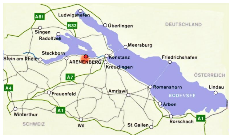
Die Karte zeigt, dass Arenenberg unweit von Konstanz und Kreuzlingen liegt.