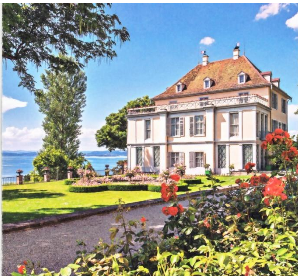
Das Schloss Arenenberg befindet sich inmitten der Arenenberger Gartenwelt und wird als schönstes Schloss am Bodensee bezeichnet

Selbstverständlich zähle ich auch unsere Fahrt in die Schweiz vom 22. bis 24. September dazu. Das wird zugleich unser Vereinsausflug sein. Nähere Einzelheiten über diese Fahrt werde ich bekannt geben, sobald ich genaue Informationen von unseren Freunden aus Tägerwilen habe. Wer im Internet schon mal "googeln" möchte, kann den Ort Arenenberg und die Insel Reichenau in das Suchfeld eingeben.